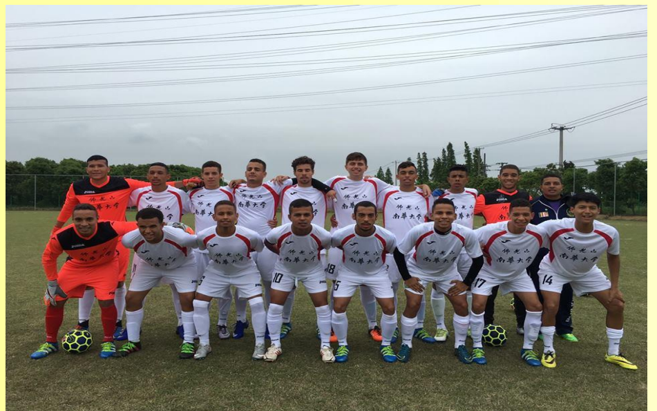
南華如來之子足球隊

一經錄取即享有四年國立收費，取得教育部甄試資格者(如全中運前八名)享有每學期一萬元獎學金補助，甄審資格者每學期兩萬元補助。