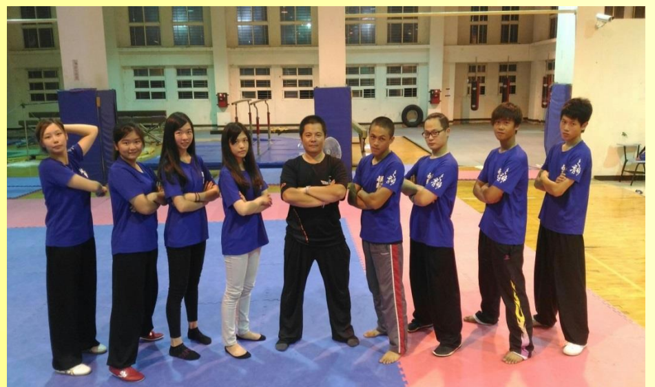
武術散打(國武術隊)